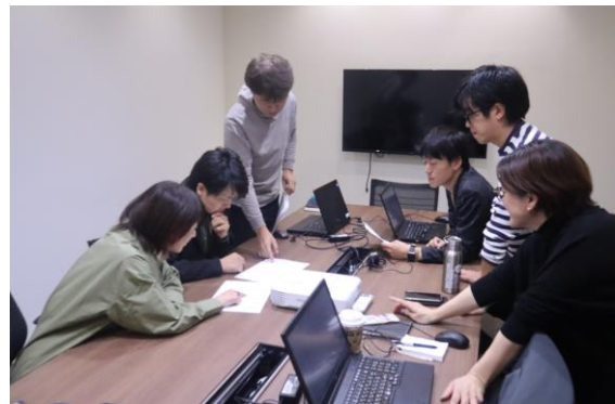
一次審査の様子（該当部署と株式会社 TIMEWELL 様）