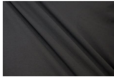
優れたストレッチ性