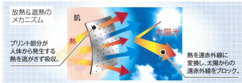
<イメージ図>放熱&遮熱のメカニズム