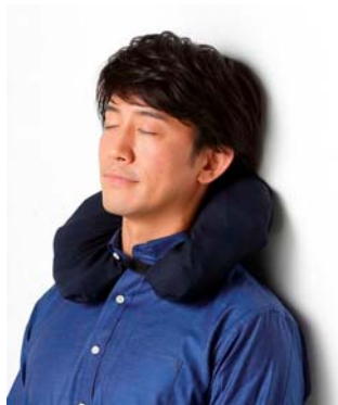
画像：ネックピローとして使用