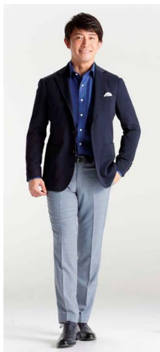
画像：「ネックピロージャケット」着用時