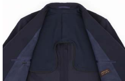
画像：裏地収納部分